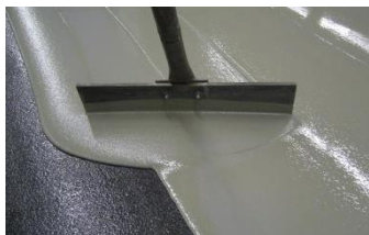
mit Stifterakel aufziehen