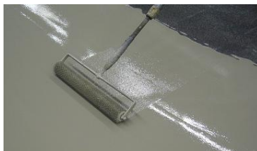
mit Stachelwalze überarbeiten